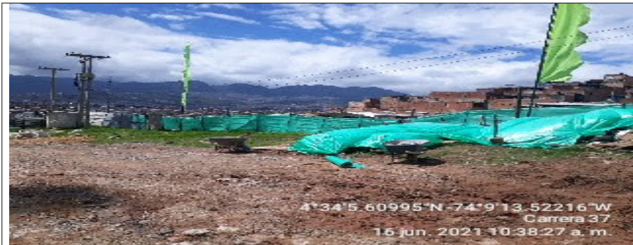
Fotografía 2. Área de parqueo de vehículos y acopio de Residuos, en desmantelación