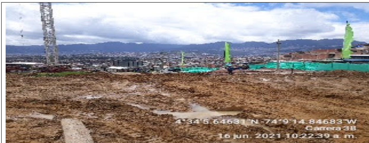
Fotografía 4. Área afectada por compactación en EEP.