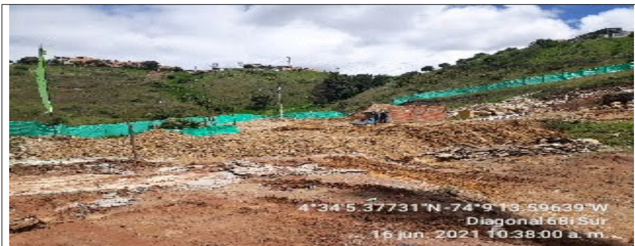
Fotografía 3. Área de acopio de materiales tipo Recebo, se evidencia compactación en EEP.