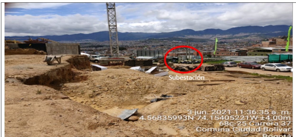
Fotografía 5. Área afectada por compactación en EEP.